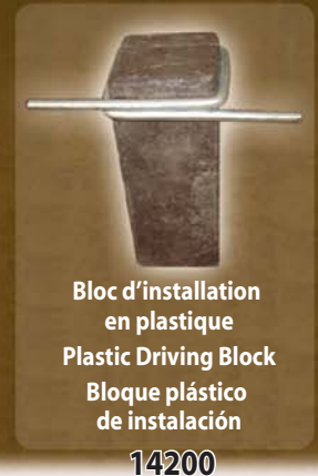
Bloc d'installation en plastique Plastic Driving Block Bloque plástico de instalación